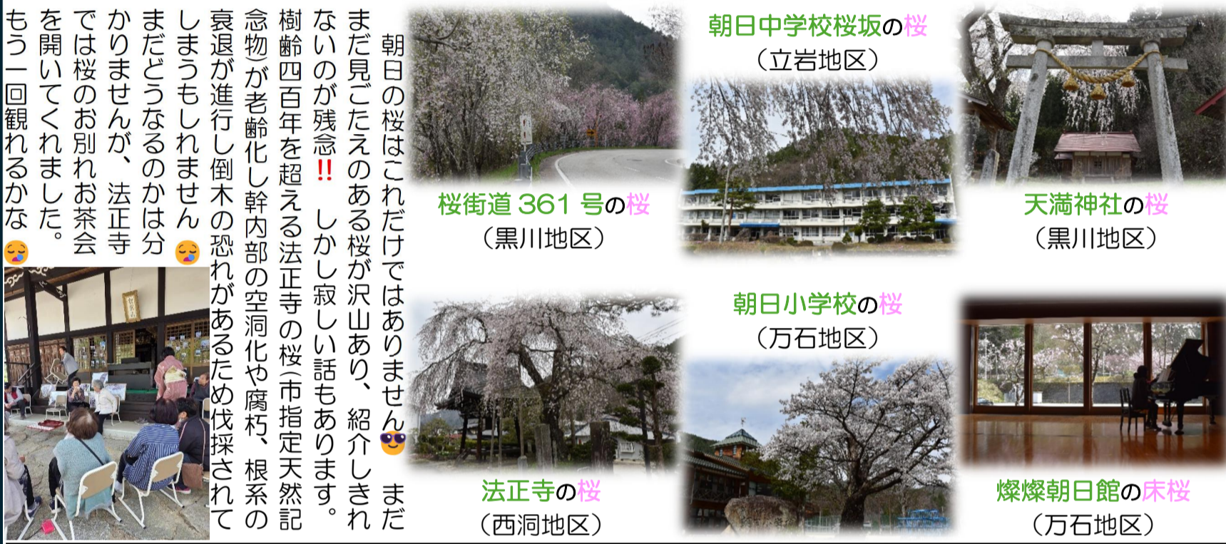
朝日中学校桜坂の桜 (立岩地区) 桜街道 361 号の桜 (黒川地区) 天満神社の桜 (黒川地区) 朝日小学校の桜 (万石地区) 法正寺の桜 (西洞地区) 燦燦朝日館の床桜 (万石地区)

朝日の桜はこれだけではありません。まだ見ごたえのある桜が沢山あり、紹介しきれないのが残念!! しかし寂しい話もあります。樹齢四百年を超える法正寺の桜市指定天然記念物が老齢化し幹内部の空洞化や腐朽、根系の衰退が進行し倒木の恐れがあるため伐採されてしまうかもしれません。まだどうなるのかは分かりませんが、法正寺では桜のお別れお茶会を開いてくれました。もう一回観れるかな