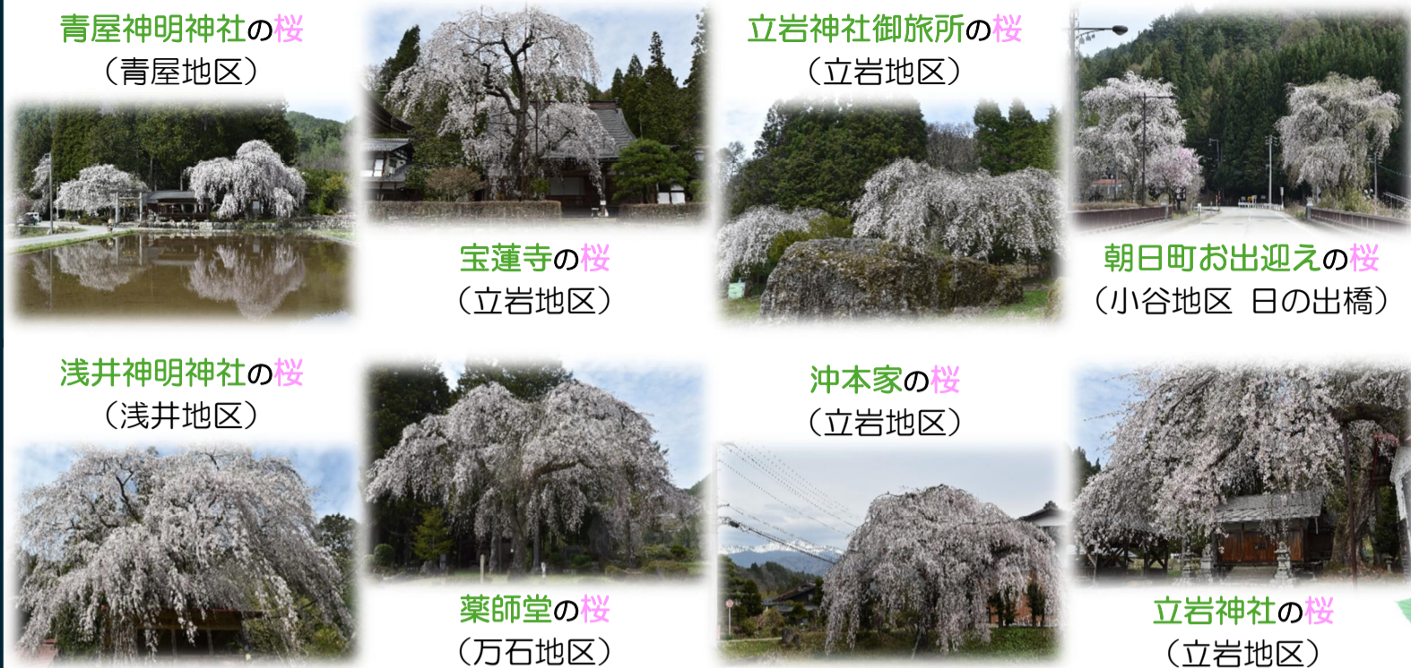
青屋神明神社の桜 (青屋地区) 立岩神社御旅所の桜 (立岩地区) 宝蓮寺の桜 (立岩地区) 朝日町お出迎いの桜 (小谷地区 日の出橋) 浅井神明神社の桜 (浅井地区) 沖本家の桜 (立岩地区) 薬師堂の桜 (万石地区) 立岩神社の桜 (立岩地区)