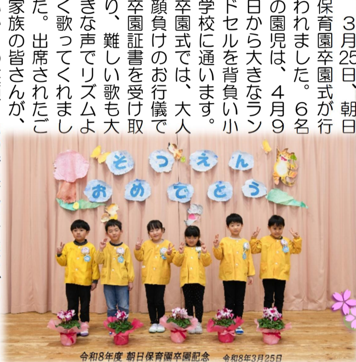
令和8年度 朝日保育園卒園記念 令和8年3月25日

3月25日、朝日保育園卒園式が行われました。6名の園児は、4月9日から大きなランドセルを背負い小学校に通います。卒園式では、大人顔負けのお行儀で卒園証書を受け取り、難しい歌も大きな声でリズムよく歌ってくれました。出席されたご家族の皆さんが、心からの笑顔と思わず溢れ出す涙をグッとこらえながら、少しずつたくましくなっていく子どもたちを見つめている姿が印象的でした。 3月6日、朝日中学校卒業証書授与式、3月24日、朝日小学校卒業式が行われました。元気いっぱい8名の児童は中学生に、すっかり大人びた10名の生徒は、義務教育課程を終え次のステップへと踏み出します。 小中卒業生は「まち協あさひ・広報高根合併号」で詳しくお伝えいたします。子どもたちは地域の宝!!これからも地域の子どもたちを、親同様の気持ちで見守りたいですね!