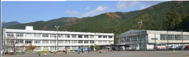
本巣市立 根尾学園