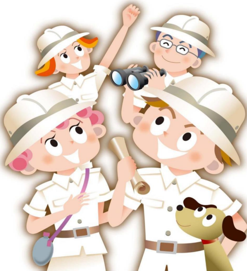
「朝日地域再発見隊マスコット」